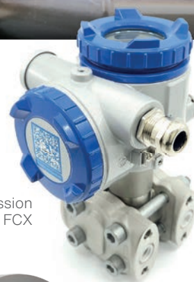
Capteur de pression différentielle FCX