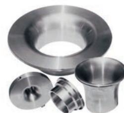
Tuyères et venturis