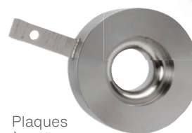
Plaques à orifice et diaphragmes