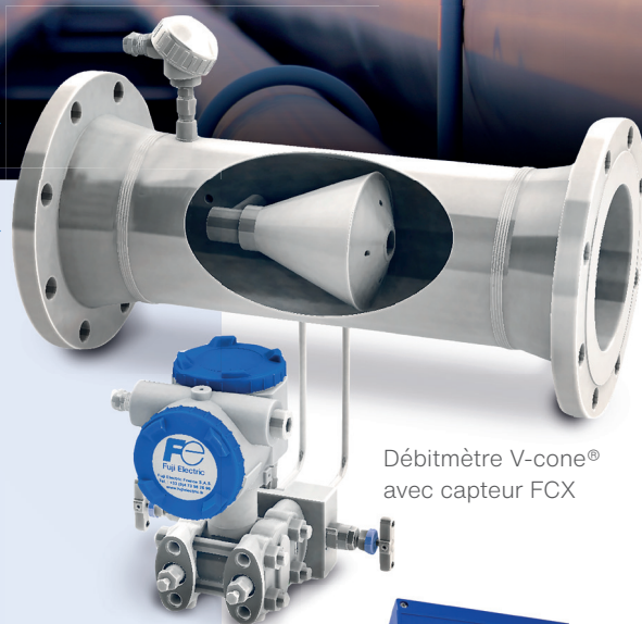
Débitmètre V-cone® avec capteur FCX

Durée de vie de plus de 25 ans, étalonnage sans arrêt de production