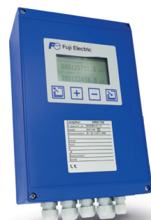
Calculateur d'énergie ERW700